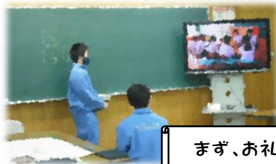
まず、お礼。お世話になりました。