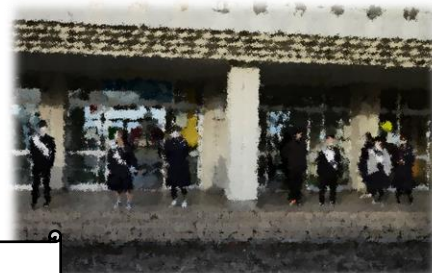
朝の選挙活動の様子