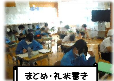
まとめ・礼状書き